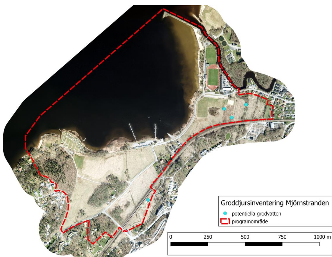
Figur 1. Karta med gräns för inventeringsområdet och markeringar för potentiella grodvatten.

Alingsås kommun arbetar med ett planprogram med syftet att undersöka möjligheterna för utveckling för sport och friluftsliv samt kompletterande bostadsbebyggelse i området Mjörnstranden i södra Alingsås. Mjörnstranden är ett till större delen öppet område, mestadels bestående av obrukat jordbrukslandskap mellan Nollhaga och Lövekulle, Mjörn och Västra Stambanan. I sydväst ökar inslaget av lövskogsdungar. Mjörnstranden är ett viktigt sport- och friluftsområde idag. Melica fick under 2019 i uppdrag att genomföra en naturvärdesinventering enligt SIS-standard för att kartlägga naturvärdena i området. Som komplement till denna genomfördes en groddjursinventering under våren 2020, vars resultat presenteras i denna rapport. Planprogramområdet är cirka 125 ha, varav 62 ha är landyta. Inventeringsområdets avgränsning samt potentiella miljöer för groddjur framgår av kartan nedan (figur 1).