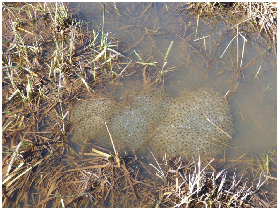
Figur 3. Romsamling av vanlig groda.

Åkergroda är en av de arter som också omfattas av 4 § artskyddsförordningen. Det innebär att det är förbjudet att 1. avsiktligt fånga eller döda djur, 2. avsiktligt störa djur, särskilt under djuren parnings-, uppfödning-, övervintrings- och flyttperioder, 3. avsiktligt förstöra eller samla in ägg i naturen, och 4. skada eller förstöra djurens fortplantningsområden eller viloplatser. Förbudet i 4 § gäller alla levnadsstadier och innebär förbud mot att exploatera lek- och övervintringsplatser oavsett om djuren för tillfället är där eller inte. Detta gäller såvida man inte genom s.k. skyddsåtgärder kan säkerställa en lika stor fortsatt reproduktion och vinteröverlevnad.